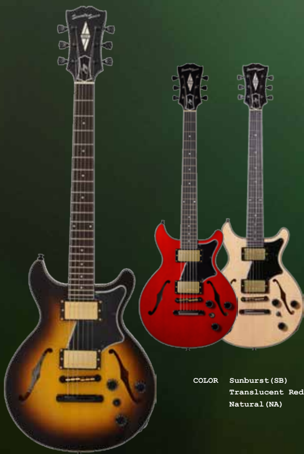
COLOR Sunburst (SB) Translucent Red (TRD) Natural (NA)