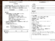
購入時に付属するオーナー登録カード

国内生産の製品に関して1年以上の保証を受ける場合、ファーストオーナー登録が必要です。(海外生産品は1年保証となります) 付属の通常保証書(1年間)とは別に、同封の愛用者カードに必要事項をご記入、投函いただきますと弊社よりお客様のご氏名、お買い上げの機種名、ご登録日を記載した特別保証書をお送りいたします。