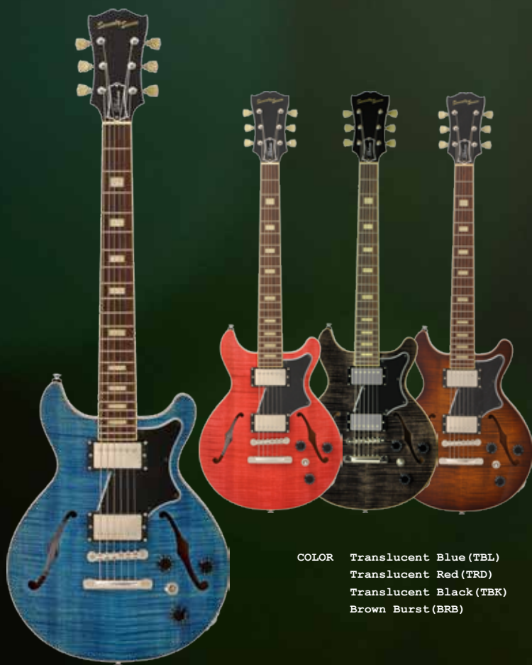
COLOR Translucent Blue (TBL) Translucent Red (TRD) Translucent Black (TBK) Brown Burst (BRB)