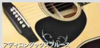
アディロンダックスプルース

指板からヘッドにかけてのツリー・オブ・ライフ、ピックガードのワンポイントなど見た目の豪華さも今までの限定モデルを超える仕様です。見た目もさることながら注目するべきはそのサウンド。アディロンダックスプルースと3ピースバックの相性が非常に良く、サスティン豊かで空間に広がるような鳴りを体験できます。HD, HF合せて50本のみ限定制作。ヘッドウェイのスタッフをして「飛鳥チームビルド史上、一番いい音がするギター」を言わしめた特別モデルの発売です。