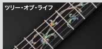
ツリー・オブ・ライフ