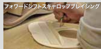
フォワードシフトスキャロップブレイシング

ダイナミクスレンジの広いスキャロップブレイシングを採用。豊かな生鳴りを表現しました。